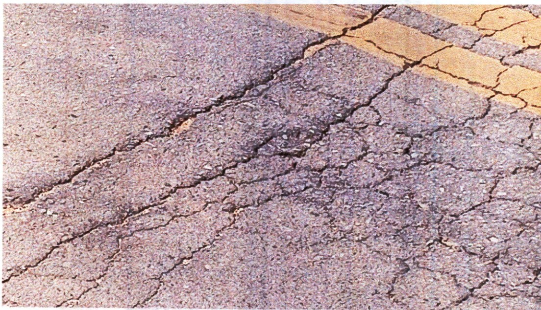
Imagem 3: Avarias na parte inferior.