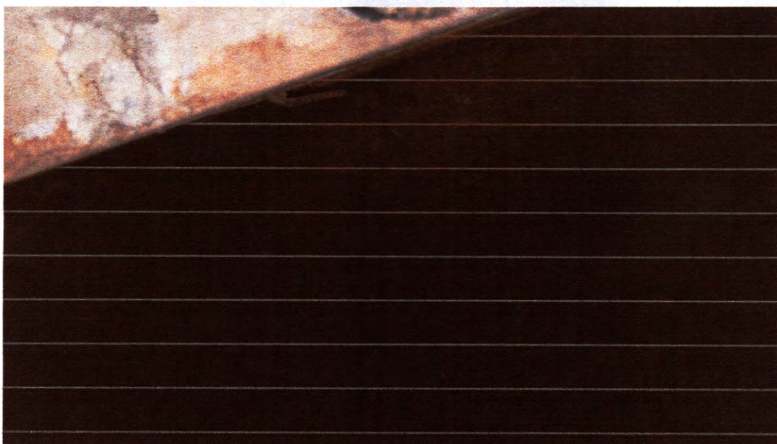
Imagem 4: Avarias na parte inferior da ponte, vista de outro ângulo.

Destarte, consoante o acima exposto, solicito que sejam tomadas as devidas providências com relação à Ponte da CE 060 que corta o Bairro Grossos, município de Várzea Alegre-CE.